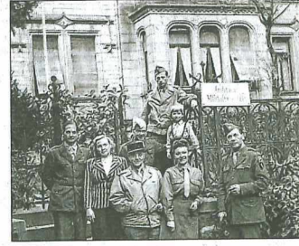
Die Besatzer: In den ersten Wochen nach dem 15. April kam es zu Plünderungen und auch Vergewaltigungen.