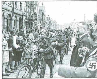
Hochburg: Offenbourg war im Dritten Reich keine löbliche Ausnahme, sondern eine Hochburg des NS-Regimes.