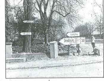
Die Wirtschaftswunderjahre: In den 1950er-Jahren wuchs Offenbourg, eine Städtepartnerschaft wurde begründet.