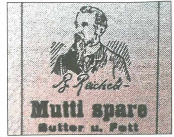
Die Rolle der Frauen: Wie die als „Soldaten der Arbeit“ beteiligten Frauen in Offenbourg mit dem Kriegsalltag klarkamen.