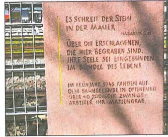
Morde bis zum Schluss: Kurz vor Kriegsende zeigte sich in Offenbourg erneut die Unmenschlichkeit des Regimes.